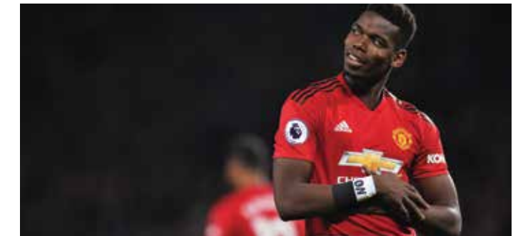
Paul Pogba, France and Manchester United footballer.

This sense of human interconnectedness is one that organisers of the challenge are promoting. As the solutions, they believe will only come once the world acts holistically and rethinks the current way of doing things. To do this, the Ubuntu Love Challenge aims to break the silos, ending asymmetry of information and thereby amplifying collaboration around the world. As such it seeks to become a meeting point to host project collaboration, initiatives, share knowledge and know-how. But is also aims to foster