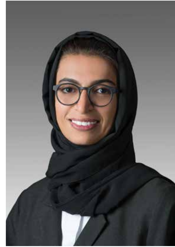
HE Noura bint Mohammed Al Kaabi, UAE Minister of Culture and Knowledge Development, joined the challenge and highlighted an important project to support the creative community in the UAE called the National Creative Relief Programme.

For more information please visit www.ubuntulovechallenge.org