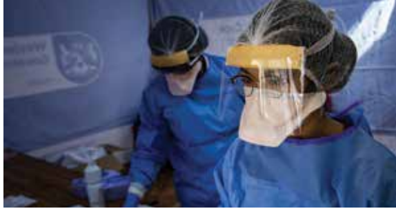
Medical workers prepare for Covid-19 testing in the Bo Kaap neighbourhood, Cape Town, South Africa, as South Africa remained on lockdown in an effort to control the spread of the coronavirus.

الحلول تأتي فقط عندما يعمل العالم مجتمعاً في جبهة واحدة، وبعد أن يعيد التفكير بالأسلوب المتبع حالياً. ولتحقيق ذلك، يهدف تحدي Ubuntu Love Challenge إلى تحطيم جدران العزلة والحد من تشتت المعلومات، وبالتالي تعزيز التعاون حول العالم انطلاقاً من سعيه لترسيخ مكانته كوجهة موحدة لاستضافة التعاون في مجالات المشاريع والمبادرات وتبادل المعرفة والخبرة. ويهدف أيضاً إلى غرس روح المجتمع العالمي ورعايتها عبر القصص والقصائد والأغاني المهمة ومختلف أشكال الفنون والعلوم التي يشاركها الناس من جميع أنحاء العالم.