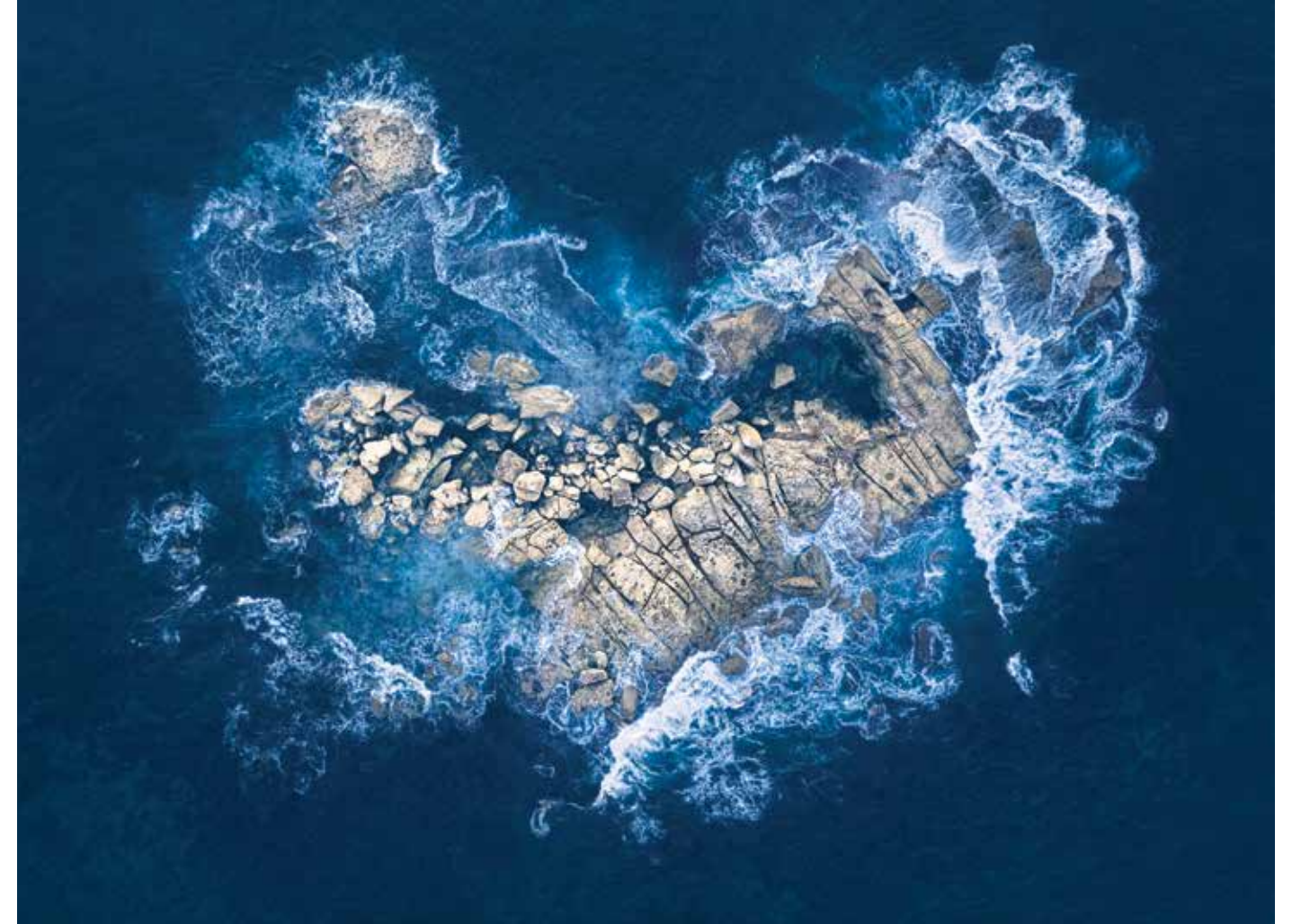
As humans, we need each other the most during times of crisis, we will always need each other to face challenges that threaten our very existence.

From its modest beginnings it has already attracted widespread support from the likes of France and Manchester United footballer Paul Pogba, Hollywood actor, Tyrese Gibson and Swedish-Lebanese singer, Maher Zain among many others.