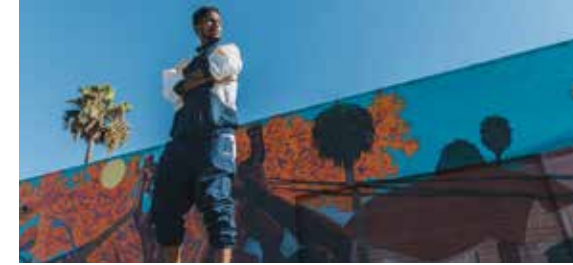
[T&B] Tyrese Gibson, American singer/songwriter/actor/author took the #UbuntuLoveChallenge, and committed to spread #LoveOverFear. WattsStix, American rapper and music producer accepted the challenge and is building something called the Think Watts HQ.

وخلال الإعلان المصور، قال بوجبا: "أقبل تحدي أوبونتو. نعيش اليوم مرحلة عصبية من حياتنا وتاريخ العالم نتيجة فيروس كورونا ومقتل جورج فلويد والعنصرية وكافة الحوادث التي تقع خلال هذه الفترة. أرغب فقط بمشاركة روعي الإيجابية وبالتحدث إلى الناس لأوضح لهم أن كل هذه الوقائع تستدعي منا التكاتف والوقوف معاً. نحن بحاجة إلى مشاركة المحبة، فالحياة لا تدور حول العنف ولا الحزن. نعلم جميعاً أن قدر الموت مكتوب علينا جميعاً وأنا سنترك كل شيء لأطفالنا، لهذا يتعين علينا تعليمهم كيفية العيش بسعادة في هذا العالم. وبوقتنا صفاً واحداً وبمساعدة ومحبة بعضنا البعض، سيكون بمقدورنا بناء عالم أفضل."