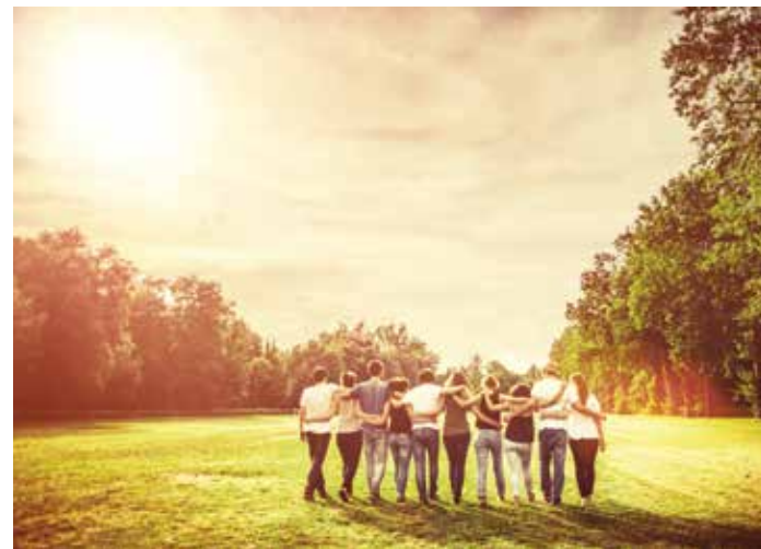
The #UbuntuLoveChallenge aims to foster and nurture a global community spirit through inspiring stories, poems, songs and different forms of art and science shared by people from around the world.

These festivals have a programme of speakers and workshops centred around mindfulness, meditation, music, yoga, art, and healing. A two-day event has been organised. The first day took place on the summer solstice when the Sun reaches its highest and lowest points in the northern and southern hemisphere on 20 June, 2020. Day two will be held on the 5 July, 2020 during the penumbral lunar eclipse. A special mass guided-meditation session is being held on both dates through a free global online live-stream.