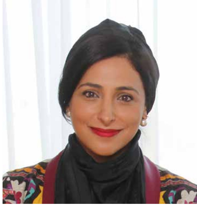
HE Sheikha Bodour Al Qasimi, Vice President of the International Publishers Association.

As he began to come to terms with his situation he noticed a growing sense of fear among people, not just in the UAE but around the world as shops, businesses and restaurants were shutdown. Where once the simple act of enjoying a walk or going grocery shopping was taken for granted had been replaced by a clawing sense of isolation.